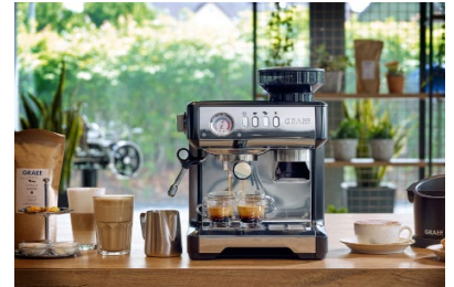
Die GRAEF CoffeeKitchen bietet alles, was sich Kaffeeliebhaber wünschen