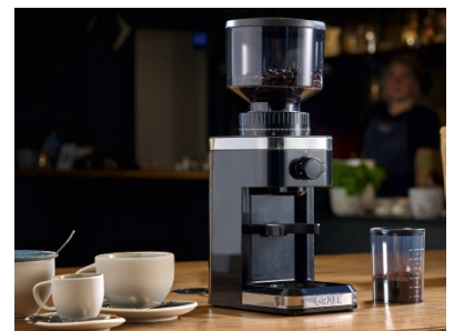
Die GRAEF Kaffeemühle CM 502 mit bis zu 140 Mahlgraden