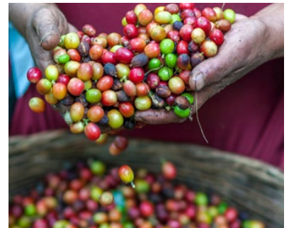
Die Third Coffee Wave setzt vor allem auf die Qualität der Kaffeebohnen