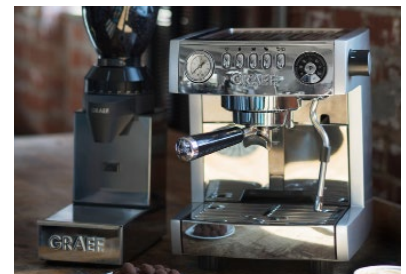
Siebträgermaschinen erfreuen sich immer größerer Beliebtheit