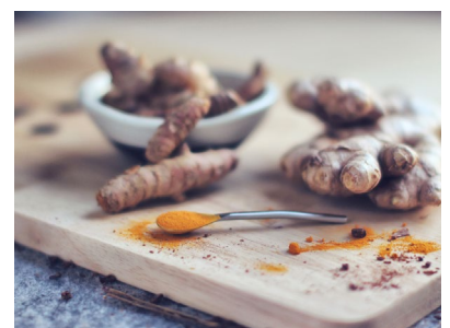
Zu den neusten Kaffeetrends zählen Kaffeeprodukte mit Superfoods wie Kurkuma