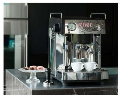
Multitalent mit zwei Thermoblöcken: die GRAEF baronessa